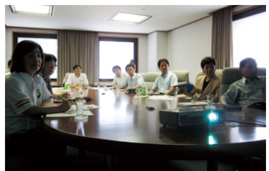
トライアル発注研修風景