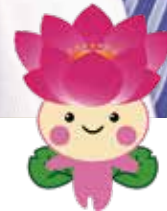
千葉市で発掘された 古代ハスの大賀ハス・キャラクター ちはなちゃん