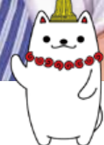
国の特別史跡となった 千葉市の加曽利貝塚・キャラクター かそりーぬ

よる生演奏を無料で鑑賞する企画を中央地区や海浜幕張地区において、7月から9月にかけて10回程度実施することとしています。