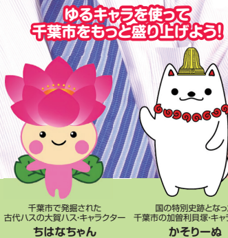
千葉市で発掘された古代ハスの大買ハスキャラクター ちはなちゃん 国の特別史跡となった千葉市の加曾利良塚キャラクター かそりーぬ